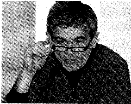
Il sindaco Sergio Chiamparino

Vertice di maggioranza in Comune. Il sindaco duro con la sinistra: «Se vi comportate come la minoranza diventa impossibile andare avanti»