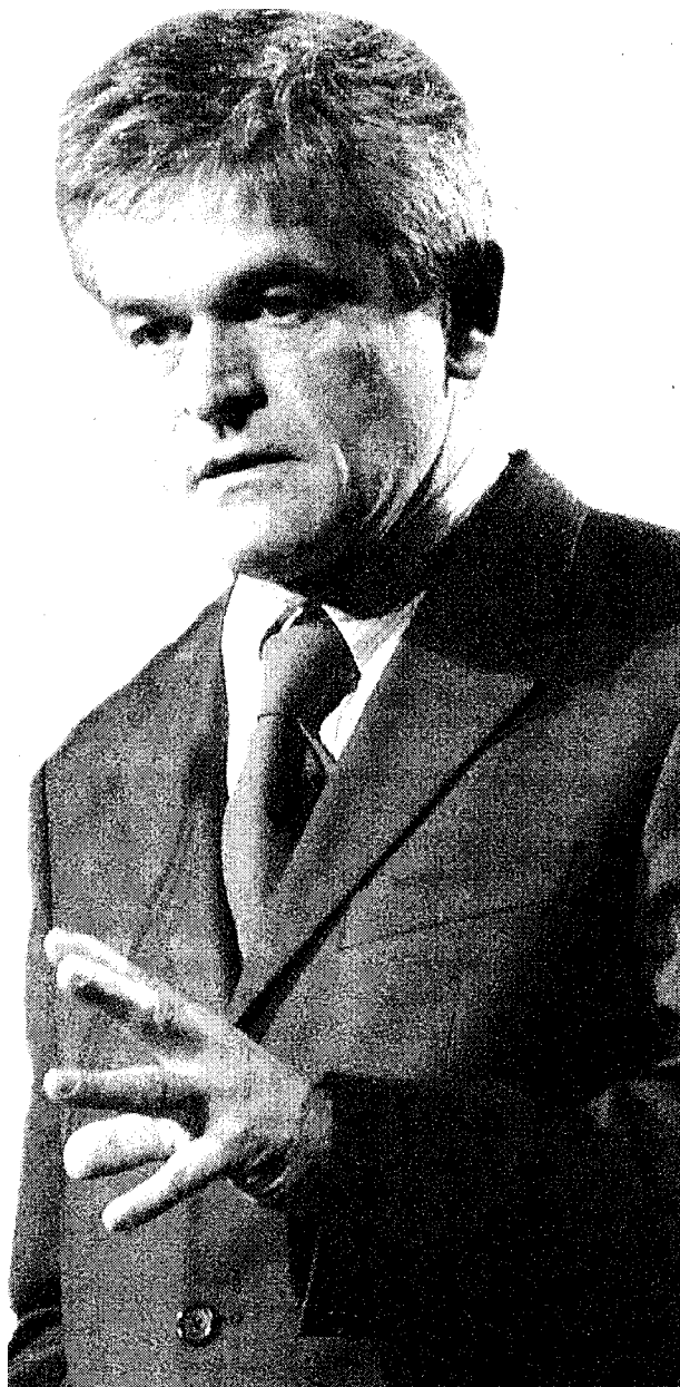
Primo cittadino Il sindaco di Torino Sergio Chiamparino (Partito democratico), 59 anni